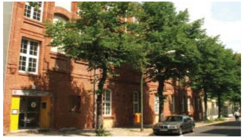
Das Jugendberatungshaus in der Glasower Straße: Anlaufstelle für verschiedene Beratungs- und Hilfeeinrichtungen; Foto: Bertil Wewer

dienste mit ihren Leistungen gewürdigt werden können, wird verwiesen auf die Internetadresse des Netzwerks www.nnb-berlin.de . Dort finden interessierte Jugendliche, Eltern oder Lehrkräfte alle wichtigen Informationen über das Angebot des Jugendberatungshauses.