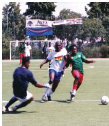
Bericht und Foto: Manfred Herrmann

Kurz nach der WM gab es im Juli ein weiteres internationales Fußballturnier in Berlin – von afrikanischen Amateuren in Neukölln. Neun Mannschaften von in Berlin lebenden Afrikanern, meist Studenten, spielten beim zweiten Baobab-Turnier mit. Es fand in diesem Jahr auf dem „Jubiläums“-Sportplatz in der Britzer Bergiusstraße statt.